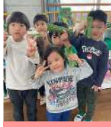
皆が丈夫で健康になりますように！@