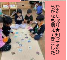
かるた取り★知っているかなも増えてきました