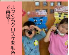
まっくろクロスケを毛糸で再現！