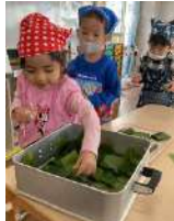
↑ムーチー作り大きなシンメーナービーに驚いていました！