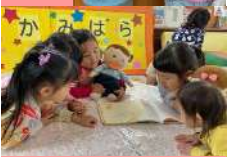
仲良く読書タイム