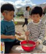
園に水を混ぜたり、泥団子作り！夢中！