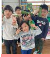
皆が丈夫で健康になりますように！@