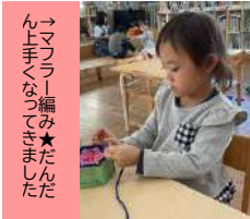
→マフラー編み★たんだん上手くなってきました

合同保育で年長児クラスへお邪魔することもある子ども達。今年度も残り2か月を切り、「年長さんになる」とイメージをする子どもも増えていきます。ちょっと難しい玩具に興味深々になり「また〇組いきたい」と楽しみにしている姿が見られます。初めは排泄に行こうとしても「一緒にいこう」と2階と違う場所に戸惑っていた子ども達。だんだん遊び方や過ごし方のコツも掴み、一步一步進級へ向けてステップアップしています。今まで慣れ親しんだ環境が変わってしまうことへの不安を感じている子、早くお兄さんお姉さんの仲間入りがしたいとワクワクしている子と、感じ方は様々です。そんな一人一人の思いを受け止め、新しいクラス・場所への移行期間をしっかりと作り安心して進級できるようにサポートしてきたいと思います。