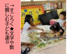
→すぐろく★文字や数に親しむ子ども達