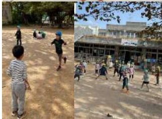
羽子板やドッジボールなど、寒さに負けず元気に体を動かしています！当たると外野、首からはセーフ、と難しいルールも少しずつ理解してきています。保育参観(2/7 金曜日)のドッジボールをお楽しみに！裏面にチーム紹介があります！