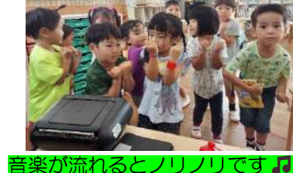
音楽が流れるとノリノリです♪