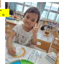
スタンプングで虹製作🌈