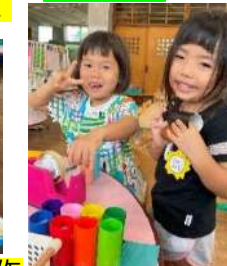
色鉛筆ケース作りの手伝いをしてくれました。