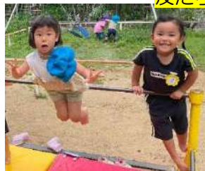
逆上がり成功！がんばりまめができる位頑張りました！