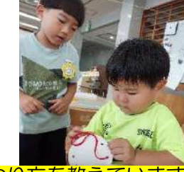
友だちにやり方を教えています！