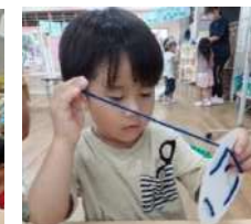
数字を見ながらひも通しを頑張っています。