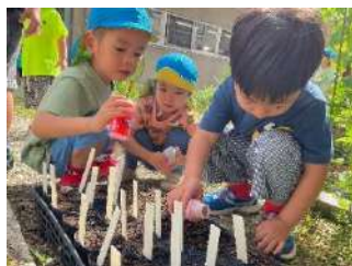
自分の朝顔に毎朝水やり頑張っています。