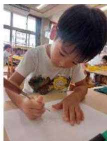
錐で穴を開けるのが結構難しい！けれど頑張っています。