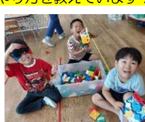
ラキューで剣や手裏剣作りが流行っています！