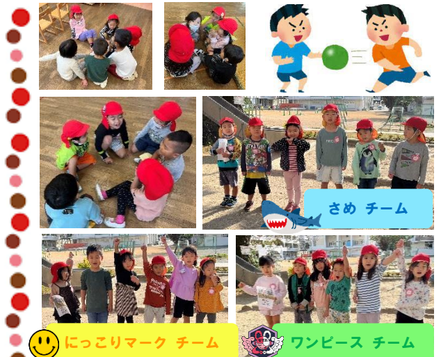
ニコりマーク チーム ワンピース チーム

ドッジボール大会に向けてチーム決めをしました。子ども達でチームのメンバーも決めてもらい、チーム名も「〇〇はどう?」「〇〇は嫌」と意見を出したり、じゃんけんでチーム名を決めたりと様々な方法で決め「ワンピース」「さめ」「ニコりマーク」の3チームとなりました。