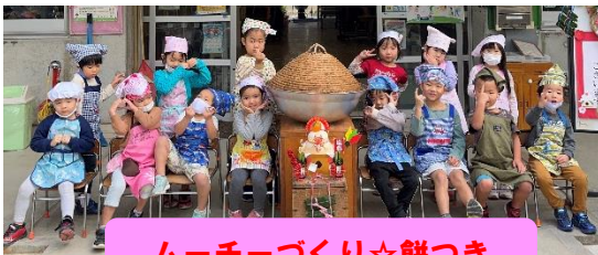
ムーチーづくり☆餅つき